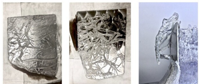
Entfernung von 2-Komponenten-Lacken unterschiedlicher Schichtdicke durch Ablösen von der Oberfläche mit den INARCO® Produkten – einfach und effizient!

Ausgehärtete 2K-Lacke/-Farben/-Kleber können bei dünnen Schichten bereits nach 10min abgelöst werden. Im Gegensatz zu Lösemitteln oder hochalkalischen Produkten werden die Schichten von der Oberfläche abgelöst und nicht aufgelöst.